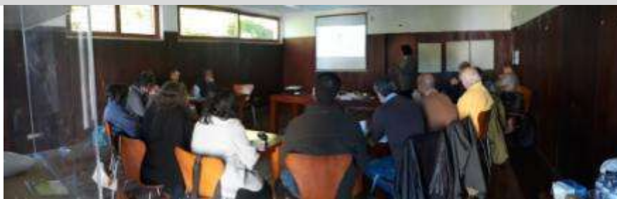
Workshop Colaborativo TerraSeixe, Odeceixe, 11 de Janeiro de 2019