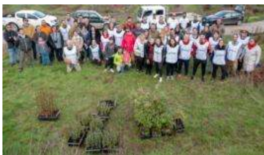
Actividade de voluntariado, 14 de Dezembro de 2019, Monchique