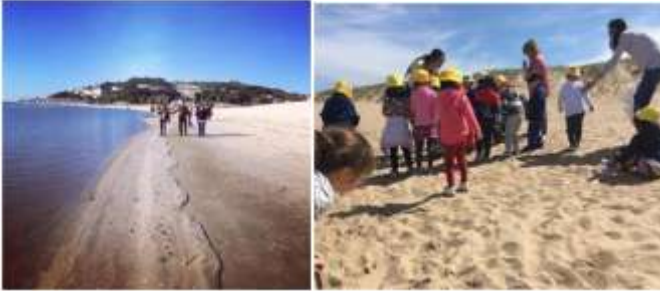
Dinamização de ateliers Coastwatch nas zonas costeiras para alunos do ensino básico