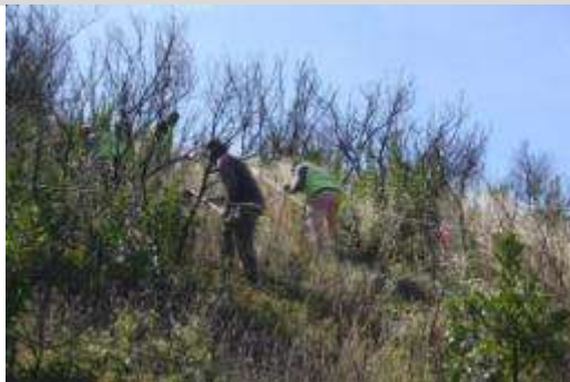
Ações de restauro ecológico, Ribeira da Perna da Negra, Monchique