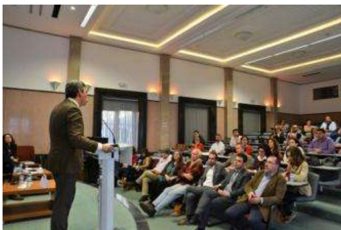
Apresentação dos resultados da operação candidatada ao CRESC Algarve 2020 – Seminário “Antes que arda outra vez”, Faro, 22 de Março de 2019