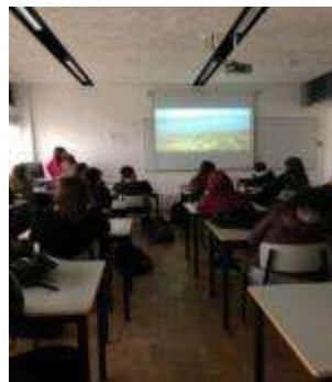
Participação e divulgação do Projeto Coastwatch em iniciativas de limpeza de praia;