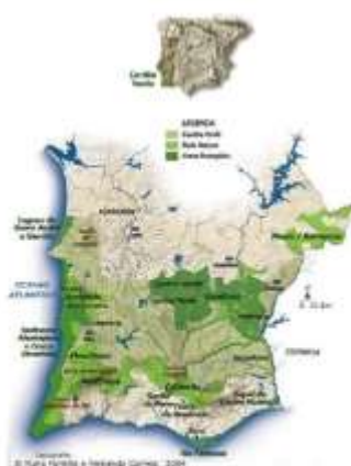
Fig. 1 – Área de intervenção do projeto Cordão Verde.

http://www.geota.pt/scid/geotWebPage/defaultCategoryViewOne.asp?categoryId=774