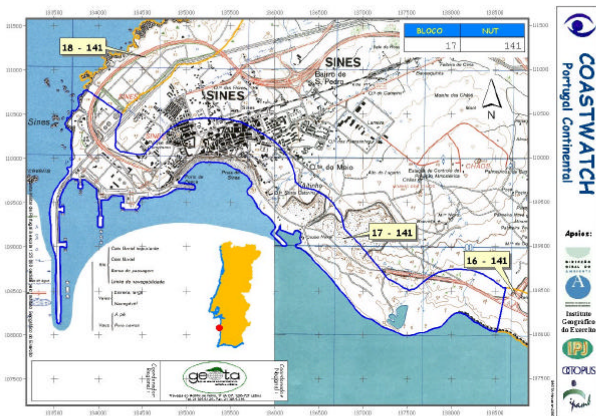
Figura 2 – Exemplo de ficha produzido pelo Litoral Digital